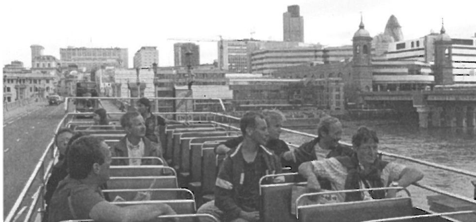
De czt als toerist in hartje Londen, zonder rugzak.

kunt haken. Na enig sleutelen durfden we het weer aan en gingen verder naar de rede van Sheerness waar we voor anker gingen. Door onze onderbreking waren we een uur of wat achterop geraakt dus kwamen we in het pikkedonker aan op de plek waar de Tineke en de Elisabeth al voor anker lagen. Zo te zien lag ook de bemanning zelf al voor anker. Wij dus ook snel een ankerplekje in de nabijheid gezocht