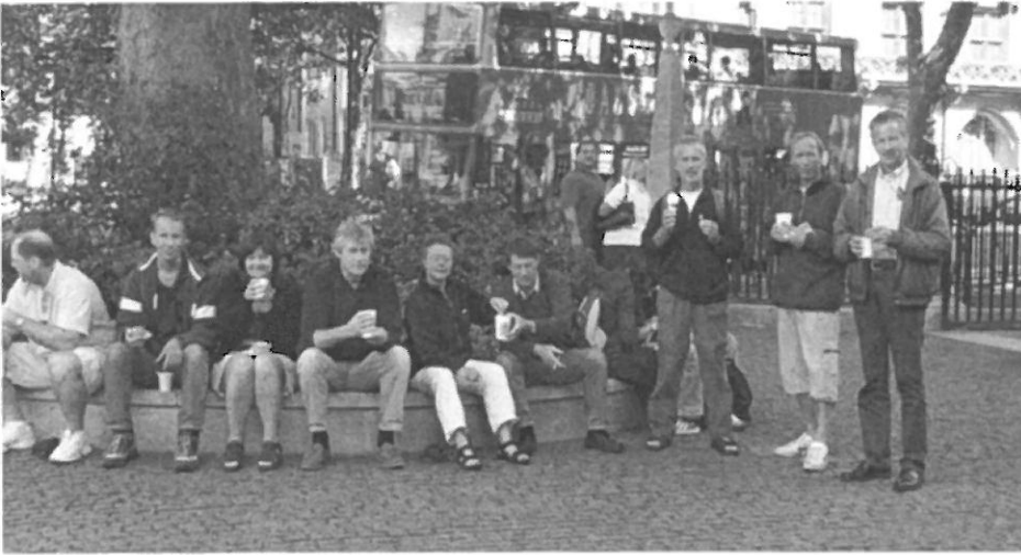
Aan de koffie voor St Paul's. Koffie slecht, stemming goed.

vertrouwen daarin was volledig verdwenen. Het was toen al half twee in de nacht dus na het eindelijk opdrinken van die beloofde borrel zijn we tot half zes de volgende ochtend maar overgegaan op het lopen van ankerwacht. Ieder een uurtje verdeelde het leed over allen. Omdat de ankerwacht van 5 uur net zo goed de zeilen kon hijsen en Rob ook al wakker werd hebben we het een paar uur terug met zoveel moeite uitgezette anker met minstens net zoveel moeite weer opgehaald en vertrokken we onder de nachtelijke sterren richting Woodbridge. Prachtig weer koers 45 graden, wind en stroming pal in de rug, 9 en een halve knoop, niet slecht vonden we. Boom er ook nog eens uit zodat de uitslapers heerlijk wiegend bleven snurken. In Woodbridge moesten we bijtijds aankomen anders zou de getijden drempel van de Woodbridge jachthaven naast de getijdenmolen Tide Mill, niet voldoende diep liggen voor onze 1,90 meter diepgang. Motor dus maar erbij voor de laatste 15 mijl. Hij liep prima totdat we vlak voor de monding van de rivier, waar je onnatuurlijk dicht langs het strand moet varen, weer onregelmatig ging lopen. De inmiddels opgehaalde fok maar snel weer uitgedraaid om in ieder geval nog reserves te hebben bij het binnenvaren. Op de rivier een prachtig uitzicht op het omringende landschap en op een paar oud engelse landhuizen. Om een uur of