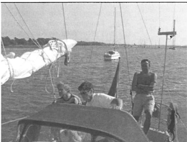
De Klazina met haar bemanning op de zonnige Deben onderweg naar Woodbridge

en het anker op de, volgens onze schippers, enige juiste manier uitgezet. Tijd voor een neut dus eindelijk om een uur of twaalf. Nou vergeet het maar, het anker krabde alsof hij daarvoor gestudeerd had en de Tineke kwam angstwekkend naderbij. Goede raad was dit keer weer niet duur maar wel hard nodig. Motor aan, anker weer op en opnieuw uitzetten. Laten we maar gelijk naar een andere plek gaan zeiden we tegen elkaar, Schrik nummer twee, een onverlicht schip recht vooruit, in het pikkedonker dus op een tiental meters afstand. Motor in zijn achteruit, en iedereen kwaad, wat zijn dat voor een stel onverlaten. Bleek het een wrak te zijn met nog wat flapperende stukken zeil in de masten en de kajuit onder water. Op dit nachtelijk uur waarop overleden bemanningen enge dingen gaan doen vonden we dat we maar rechtsomkeert moesten maken en weer een andere plaats moesten gaan zoeken. Weer anker uit en wéér krabben. Uiteindelijk een ander anker aangehaakt, Danfort, deze hield het gelukkig. Maar het