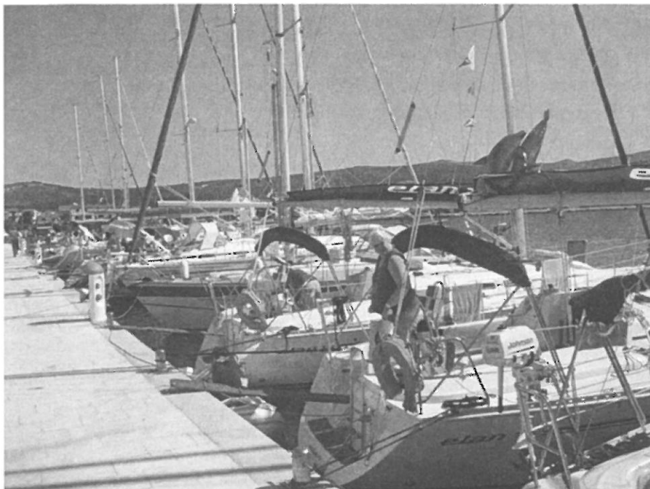
Astrid Frikkee in Kroatische wateren.

in Rogoznica waar ontzettend veel luxe schepen hun vaste ligplaats hadden. Het leek wel Antibes in Zuid-Frankrijk.